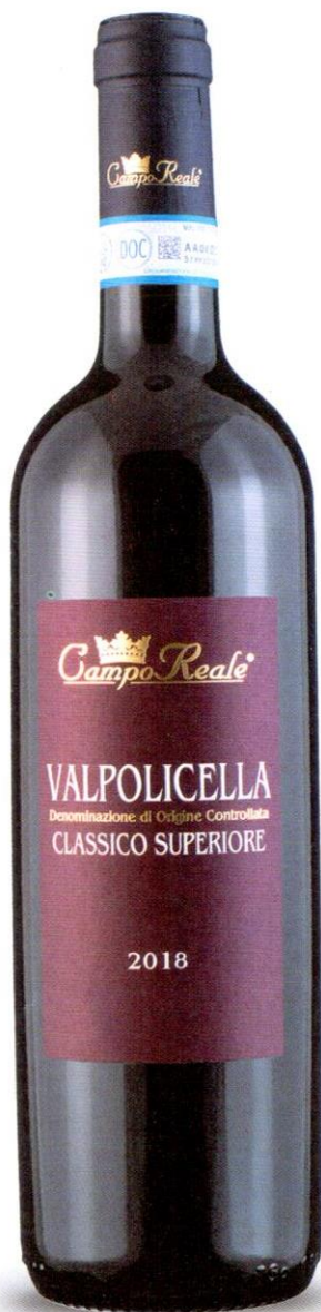
Valpolicella Classico Superiore DOC 2018 14°